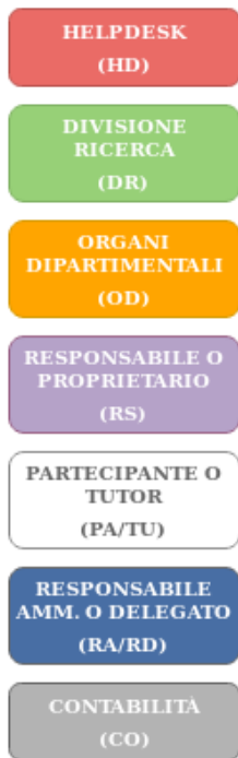
Grafico del flusso