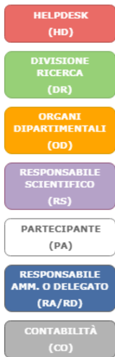
Grafico del flusso