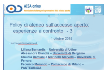
Policy di Ateneo sull'accesso aperto: esperienze a confronto - 3 [1 ottobre 2015 (registrazione durata: h. 2:39. 03)]

Paola Galimberti - Pilot FP7 Post Grant: le azioni intraprese presso l'Università Statale di Milano - ppt